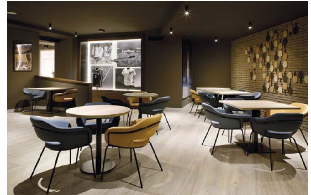
En los salones se han elegido los tonos claros en suelos y techos, combinándolos con estructuras en tonos oscuros como homenaje a la lava del Etna. Es la definición de un nuevo estilo mediterráneo que da al conjunto contemporaneidad y elegancia. Los pavimentos son Par-Ker® Tanzania de Porcelanosa.